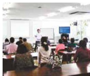
企業での講習会(運動)