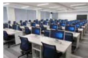
視聴覚・情報科学室