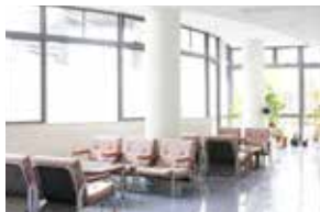
コミュニティースペース