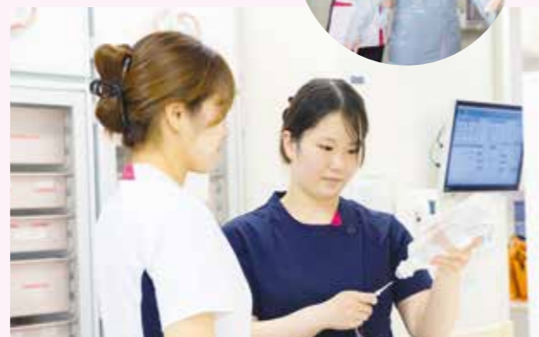
看護技術演習(各部署として)