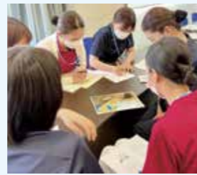
グループに分かれて「まとめの会」