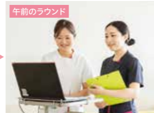
午前のラウンド 状況を電子カルテに記録