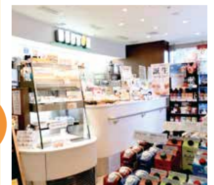
Place: コーヒーショップ