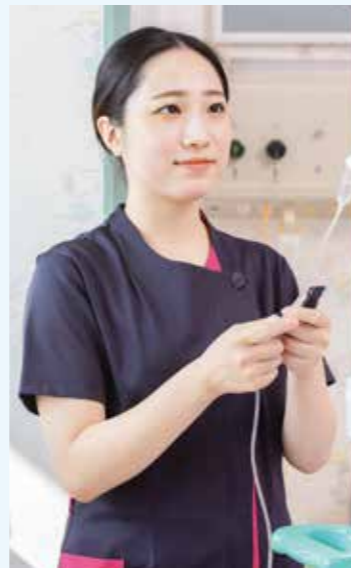
さあ、滴下訓練をやってみよう!