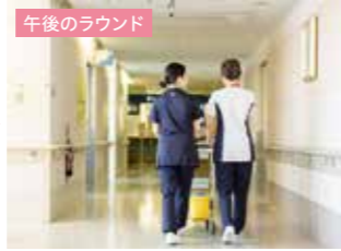
午後のラウンド 可能な限りペアで行動