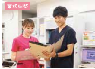
業務調整 リーダーへの報告