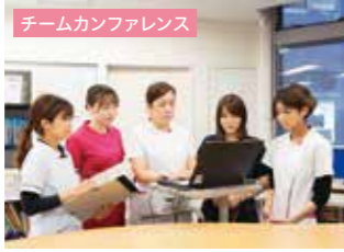
チームカンファレンス 他職種・チームで情報共有