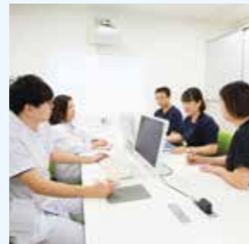
多職種とのカンファレンスに参加