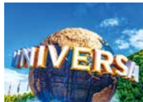
ユニバーサルスタジオジャパン