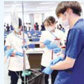
みんなで輸液の手順を確認中