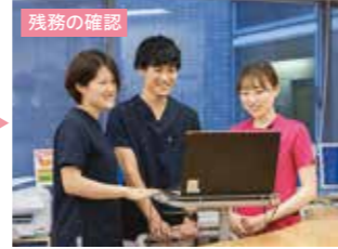
残務の確認 夜勤者への申し送りも