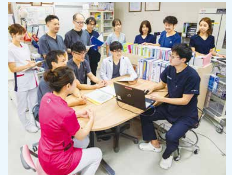
医師、診療看護師と一緒にカンファレンスを行っています