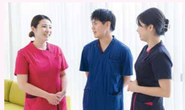
看護技術演習 多重課題