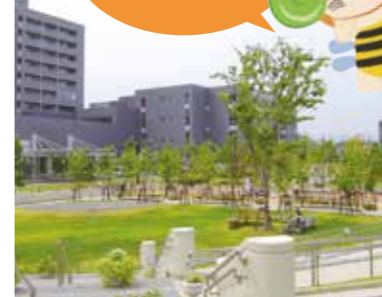
Place: ホスピタルパーク