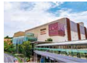
阪急西宮ガーデンズ(西宮北口駅)