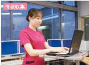
情報収集 夜間の情報と今日の予定の確認