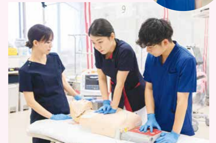
看護技術演習(急変時の対応)