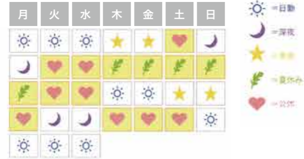
病院勤務1年目：ある新人看護師の8月のシフト

勤務は、4週8休制で休日の希望が通ることが多いため連休も取れます。また、育児休業・育児短時間勤務・看護休暇など育児支援の制度も手厚く働きやすい環境です。