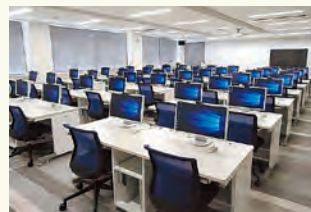
視聴覚・情報科学室