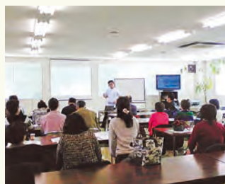
企業での講習会(運動)