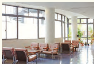
コミュニティスペース