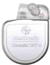
図3 除細動器付き両心室ペースメーカー

通常のペースメーカー機能に加え、心不全治療機能と致死性の不整脈(心室頻拍、心室拍動)を治療する機能を搭載した植込み型の治療機器です。